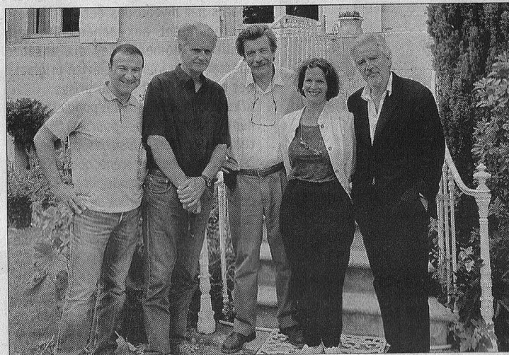
Pierre Arditi (à droite), acteur heureux devant une demeure charentaise qu'il apprécie avec les propriétaires, le directeur de production et le réalisateur.